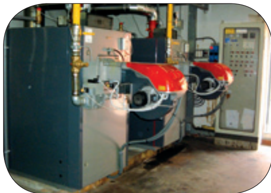
STABILIMENTI INDUSTRIALI MENARINI LOCALITA' CAPALLE (PRATO): INSTALLAZIONE DI CALDAIE A CONDENSAZIONE CON POTENZIALITA' DA 1.2 MW