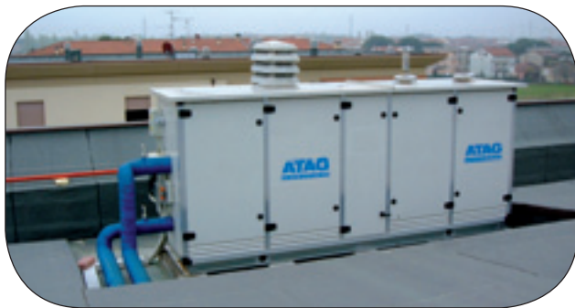
COOPERTATIVA EDILCOOP "TORRI DI GALCIANA": REALIZZAZIONE DI IMPIANTO CENTRALIZZATO CON RIPARTIZIONE DEI CONSUMI PER OGNI SINGOLO ALLOGGIO