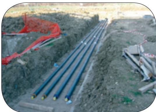
CANTIERE PER NUOVE LOTTIZZAZIONI A SESTO FIORENTINO: REALIZZAZIONE IMPIANTO DI TELERISCALDAMENTO ALIMENTATO DA MOTORI A GAS METANO COGENERATIVI