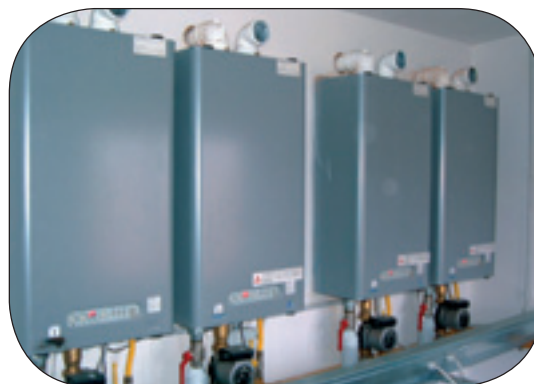
CONDOMINIO VIA DELLE FONTI FIRENZE: RIQUALIFICAZIONE TECNOLOGICA DELLA CENTRALE TERMICA CON INSTALLAZIONE DI MODULI TERMICI A CONDENSAZIONE CON INSERIMENTO A CASCATA