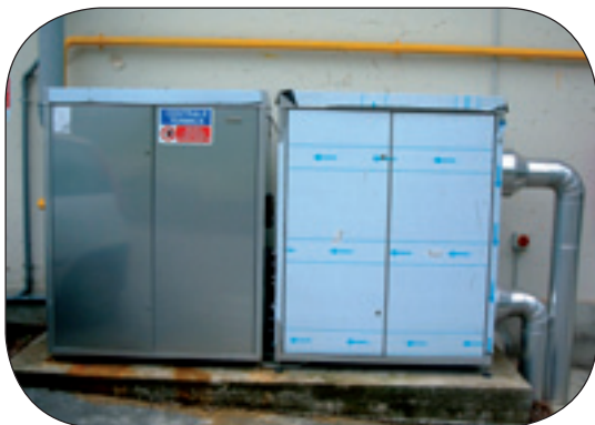
STABILIMENTI INDUSTRIALI SANELLI LOCALITA' SIGNA (FIRENZE): TRASFORMAZIONE DI IMPIANTO DA GASOLIO A METANO CON INSTALLAZIONE DI MODULI TERMICI A CONDENSAZIONE DA ESTERNO